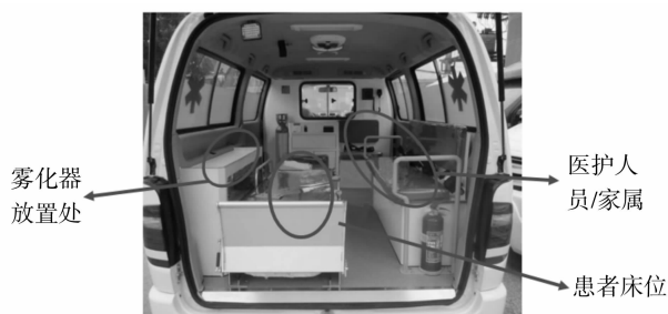
图 5 救护车及雾化器参考放置位置