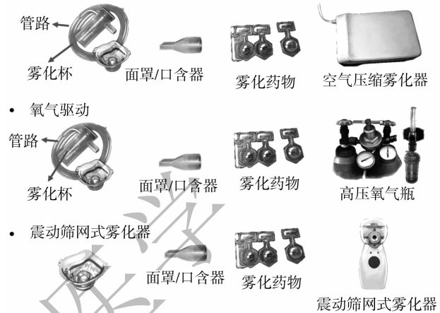
图 2 雾化准备物品

低氧血症或缺氧明显的患者,若条件允许,推荐行氧气驱动雾化,氧气驱动雾化期间,一般不需额外吸氧。物品准备完毕后将雾化药液加入雾化杯中,容量推荐在 4 ~ 6 mL [9] 。