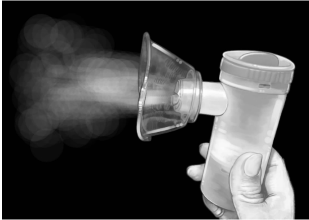
图 4 氧气驱动雾化装置

察有雾化药液成雾状喷出 [9] (见图 4)。机械通气联合雾化治疗,需要了解呼吸机是否带雾化功能,并在雾化治疗过程中调整呼吸机性能相关参数。